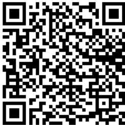
Qr-code voor android