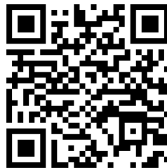
Qr-code voor apple